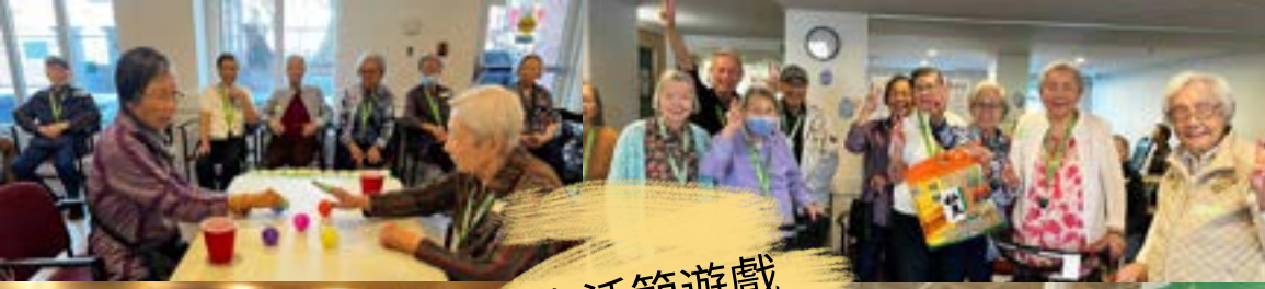
復活節遊戲 大比拼