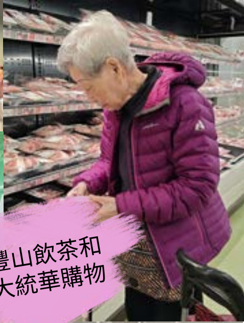
豐山飲茶和 大統華購物